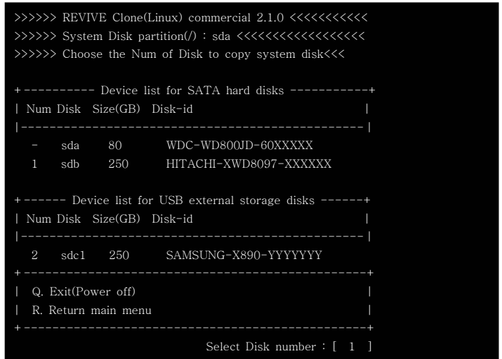
(그림 2) 메뉴선택

(1. REVIVE Main Menu) 에서 1번을 누르면 아래 화면이 나타나고 여기에서 시스템을 복제할 대상 하드디스크번호를 선택한 후 엔터를 치면 아래 (그림3)에서처럼 클로닝이 수행됩니다.