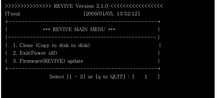
(그림 1) 메뉴선택